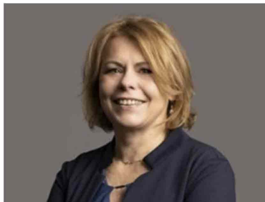
L'oceanografa fisica Sabrina Speich, professore all'École normale supérieure di Parigi

sempre di più verso i Poli, ogni anno di qualche chilometro, perché cercano le stesse temperature, ma quando ci saranno queste ondate di calore molto importanti nel mare non tutti gli organismi si potranno adattare».